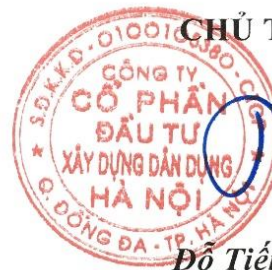
Đỗ Tiến Lợi